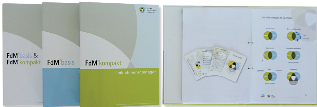
FdM®kompakt & basis: Trainerleitfaden, Teilnehmerunterlagen u. Merkkarten

Außerdem können Führungskräfte, die am FdM®kompakt teilgenommen haben, für ihre Mitarbeiter ein FdM®basis buchen. FdM®basis ist ein vierstündiger Workshop, der den Mitarbeitern eine Einführung in den FdM-Ansatz gibt und sie mit dem 3K-Modell vertraut macht. Das erleichtert es den teilnehmenden Führungskräften, die neu erlernten Konzepte in die Praxis umzusetzen.